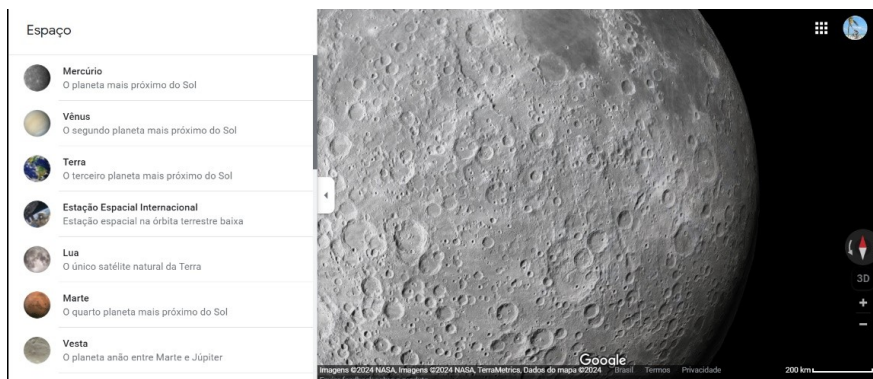
Figura 2- Crateras lunares, via satélite.

Conforme visualizado na Figura 3 podemos dinamizar nossas aulas tornando-as mais lúdicas e interdisciplinares ao clicar na opção Estação Espacial Internacional.