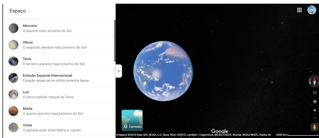
Figura 1 - Planeta Terra, via satélite.

A Figura 1 apresenta a mínima colocação de zoom surgindo visualmente o planeta Terra, no lado esquerdo a lista de planetas é apresentada. Dessa forma, o docente coloca um novo planeta caso seja seu desejo deixar mais claro o sistema solar.