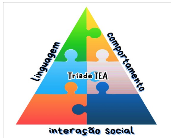
Figura 2 – Tríade TEA, pilares das áreas de manifestação do espectro

A interação social; comunicação; comportamento restrito e repetitivos 9. Além disso, muitas pessoas com TEA apresentam hipersensibilidade ou hipossensibilidade sensorial, reagindo de forma incomum a estímulos sensoriais [10]. O diagnóstico do autismo é um processo envolve avaliação clínica, observação do comportamento e entrevistas com pais e cuidadores.