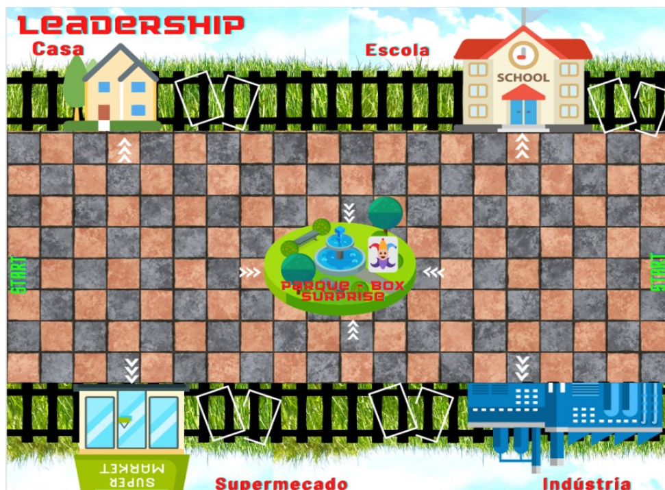
Figura 1 – Tabuleiro

Na Figura 1 apresenta a imagem do tabuleiro do jogo, composto por quatro cenários: Escola, Casa, Supermercado e Indústria. Os jogadores recebem quatro cartas temáticas, que representam os objetivos a serem alcançados nas áreas de Social, Saúde e Bem-Estar, Meio Ambiente e Paz e Prosperidade. Essas cartas orientam as metas de cada participante dentro do contexto do jogo. Além disso, as cartas win e loss ilustram os desafios propostos pela ONU, sendo apresentadas com símbolos e descrições específicas, conforme ilustrado na Figura 2. Todos os designs do jogo foram desenvolvidos utilizando ferramentas de design visual.