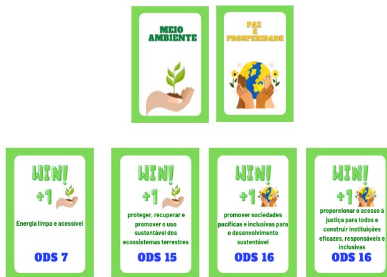
Figura 3 – Exemplo de formação de pares

Conforme apresentado na Figura 3, vence o jogador que reunir 2 cartas win em cada tema proposto, assegurando que os símbolos das cartas coincidam com os temas.