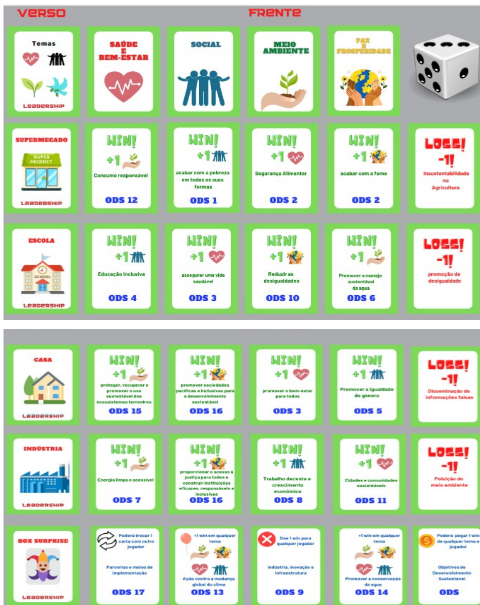
Figura 2 – Modelo de cartas

Destaca-se que o tabuleiro e as cartas temáticas do jogo foram projetados para serem impressos, garantindo uma experiência tátil e interativa aos jogadores. A impressão dos materiais facilita a manipulação física do tabuleiro e das cartas, proporcionando uma experiência completa no ambiente de jogo. Além disso, o uso impresso permite que o jogo seja facilmente adaptado para diferentes contextos